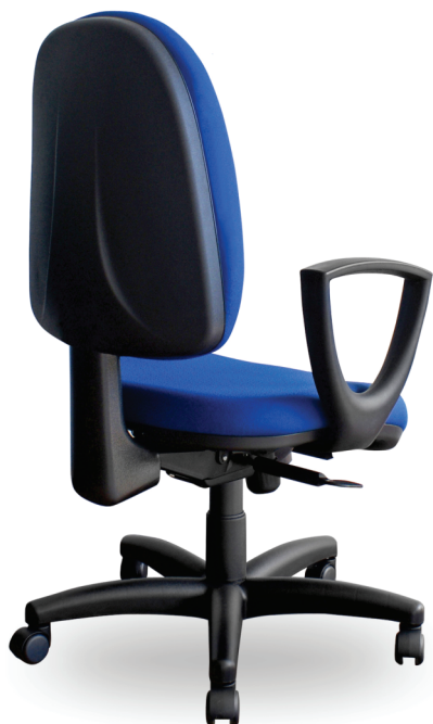
Foto meramente ilustrativa, kit sem tapeçaria.

A linha B-Side tem design ergonômico e tradicional, sendo um dos produtos "Best-Seller" da Rhodes.